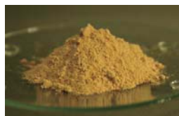
写真 メリンジョレスベラトロール-20

当社のみつばち健康科学研究所と武庫川女子大学 国際健康開発研究所所長の家森幸男先生が共同で調査・探索した健康素材「メリンジョ」由来のレスベラトロールを配合した天然素材原料。メリンジョレスベラトロール20%と高含有なので、副素材としてもご利用いただけます。