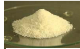
写真1. はちみつパラチノース

粉末化に用いたパラチノースは、血糖値の上昇を抑制する効果や内臓脂肪の蓄積を抑制する効果が報告されています。