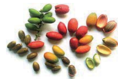
写真4. メリンジョの実